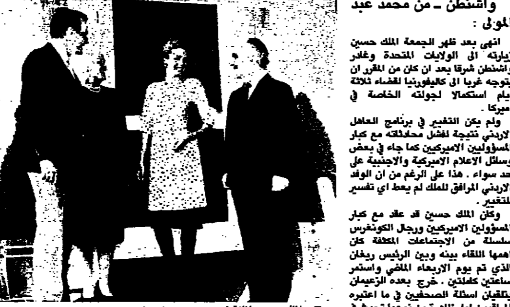
الملك حسين والملكة نور مع جورج بوش نائب الرئيس الاميركي وتوجهه بريليه قبل مغادرة العامل الاردني واشطن لن لندن (اب راديو)